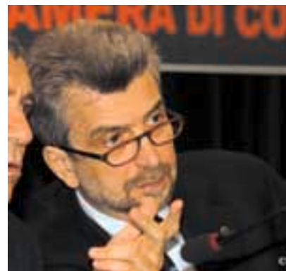
Il Ministro del Lavoro, Cesare Damiano

Più chiara appare la previsione di cui al comma 3, che attribuisce agli Organismi paritetici la possibilità di richiedere controlli mirati per specifiche situazioni. Va peraltro rilevato criticamente che il riferimento all'organo di indirizzo politico e non direttamente alla Asl, o ad altra struttura ispettiva competente, rischia di ritardare l'intervento dell'organo di vigilanza. In conclusione, anche la possibilità di effettuare sopralluoghi, ora riconosciuta per legge agli Organismi paritetici, andrebbe propriamente indirizzata, in più stretto raccordo con quanto disposto nei criteri di delega per il Testo unico, al sostegno delle misure prevenzionali ed alla individuazione di pratiche migliorative; il che presuppone d'altro lato che gli organismi paritetici dispongano di una struttura tecnica permanente per l'esercizio reale delle più ampie attribuzioni.