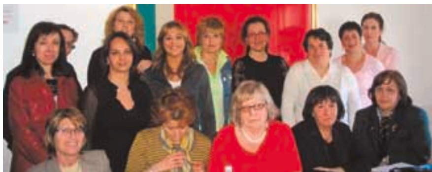
Coordinamento donne UIL Piemonte.

Con queste basi siamo ripartite e stiamo sviluppando il nostro progetto. Con questo spirito stiamo lavorando per riaggregare ed allargare il Coordinamento per le Pari Opportunità, per elaborare il materiale da presentare al prossimo congresso della UIL Piemonte; per preparare una iniziativa pubblica che dia visibilità al Coordinamento per le Pari Opportunità della UIL Piemonte.