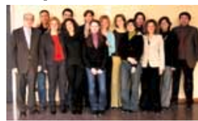
Staff ENFAP Piemonte

Vi aspettiamo numerosi, certi di potervi fornire un servizio migliore all'altezza delle aspettative del Sindacato dei Cittadini e con l'occasione, vorrei ringraziare la Segreteria UIL Piemonte che ha permesso di realizzare un sogno di tutti noi che operiamo in EnFAP.