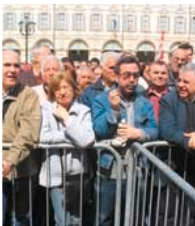
Pensionati alla manifestazione del 1° maggio

L'obiettivo sul quale abbiamo profuso tutto il possibile impegno politico/organizzativo dell'organizzazione è stato quello di arrivare a sottoscrivere, nel più alto numero di comuni della nostra provincia, intese ed accordi che permettessero di salvaguardare e migliorare le condizioni dei cittadini che hanno difficoltà economiche.