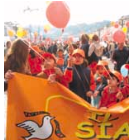
Bambini alla sfilata del 1° maggio

Sul piano industriale, la Fiat ha giocato un ruolo essenziale, talvolta egemonico, nella storia di Torino e del Piemonte. Il rapporto con la città è stato altalenante, e, soprattutto negli ultimi anni, è stato meno positivo e più sofferto. Recentemente due avvenimenti, nettamente in controtendenza, alimentano il nostro ottimismo. Il primo riguarda l'avvio imminente della linea della Grande Punto a Mirafiori, che rappresenta, per noi, la conquista di un obiettivo strategico in quanto garantisce il mantenimento dell'attività produttiva nello stabilimento di Mirafiori. Resta ora l'obiettivo di fondo per cui