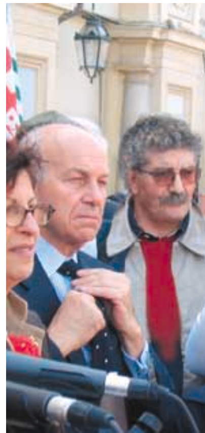
Rossetto con Bertinotti - 1° maggio Piazza S. Carlo

A partire da questo 1° Maggio 2006 , con un Paese che sta voltando pagina, ci siamo finalmente sentite persone libere, più libere, e ancor più determinate a riprendere le nostre battaglie e le nostre lotte. Oggi ritornano la speranza, l'entusiasmo, l'impegno per un presente ed un futuro migliori: partendo dalla memoria, dalla lotta di liberazione e dalle conquiste civili e sociali possiamo costruire il nostro futuro, quello dei nostri figli e delle future generazioni.