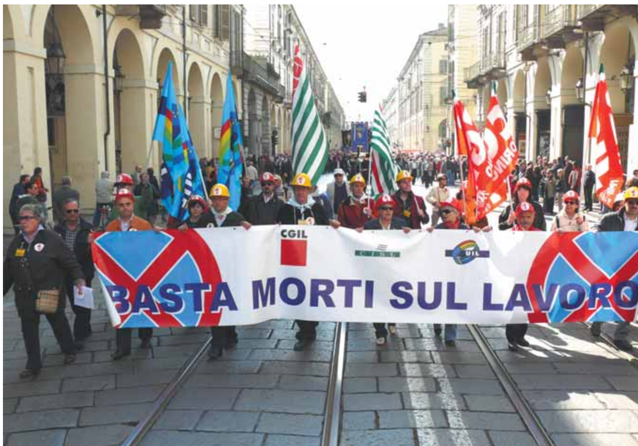
Manifestazione 1° maggio 2008 - UIL, CGIL, CISL. Torino