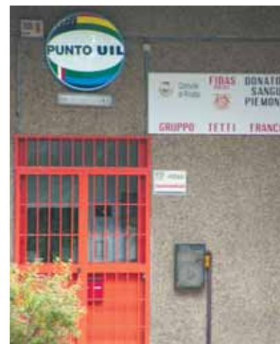
Punto UIL - Rivalta (nuova apertura marzo 2008)

Il neo ministro dell'economia, Giulio Tremonti, nelle prime dichiarazioni ha detto, tra l'altro, che qualche sacrificio