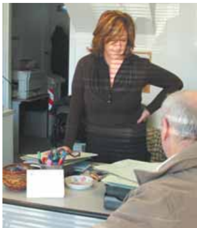
Patronato ITAL - Moncalieri

adesso ricadrà sui banchieri e sui petrolieri. Sarebbe una novità, meglio tardi che mai. Come al solito, da moderati quali noi della UIL siamo, ci accontenteremmo anche di meno. Per noi è essenziale ad esempio, la possibilità di ricontrattazione del mutuo per la prima casa (in modo da fare rifiutare le famiglie in difficoltà) e la messa sotto controllo dei prezzi, delle tariffe e dei generi di prima necessità. Per quel che riguarda l'ICI, benvenuta la misura di abbattimento per le case di residenza, se sarà accompagnato da certezze sull'invarianza dei trasferimenti tra stato centrale ed istituzioni decentrate. Questo per far in modo da rendere ingiustificati eventuali aggravii delle tasse locali.