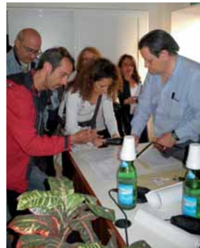
Inizio della raccolta firme per salvare l'ex Bertone.

Purtroppo anche ai migliori dottori "comuni mortali" capita di avere la memoria molto corta e Airaudò ne è l'esempio, ma una cosa gli va riconosciuta: di aver scritto la pagina più vergognosa negli ultimi 10 anni sulla democrazia sindacale e di essere un vero artista sul come si possa fare propaganda ingannevole.