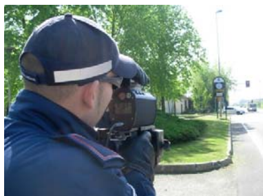
Ricorrere contro le multe stradali costa 38 euro

La finanziaria 2010 ha introdotto il contributo unificato ovvero la tassa sui ricorsi contro le multe stradali, abolendo l'esenzione prevista fino al 31 dicembre 2009; alle opposizioni contro le sanzioni amministrative che erano esenti dal pagamento, ora si applicano le tariffe già in vigore dal 2005 per le altre cause di valore determinato, più un importo fisso di 8 euro.