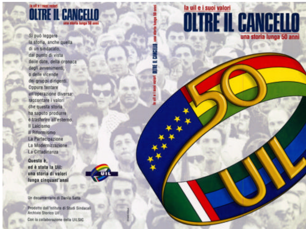
Locandina del film documentario “Oltre il cancello”

L’Istituto ha aperto la “sfida” con la produzione di un film documentario dal titolo “Oltre il cancello”, in occasione del cinquantesimo anniversario della fondazione della Uil. Una lettura ragionata dell’azione svolta dalla Uil dalla sua fondazione ai nostri giorni, scorrendo la storia del nostro Paese, l’evoluzione della società, la sua maturazione e le sue battaglie per affermare quegli ideali che sono poi l’asse portante della Uil. Questa scelta non è stata casuale, in quanto con essa si è voluto da un lato rimarcare le basi ideali dalle quali l’Istituto prendeva a muovere e dall’altro fissare nella memoria, possibilmente non solo dell’organizzazione, le tappe, le pietre miliari percorse dal sindacato alla guida dei lavoratori.