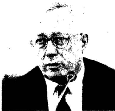
Il ministro Giulio Tremonti

La soluzione che si profilerebbe è quella di un varo subito di una manovra «leggera», «anche più di quella dello scorso anno», riferiscono tecnici vicino al governo, per poi verificare più in là, quando la manovra sarà in Parlamento, la disponibilità di risorse per fi-